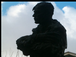
Kleine Goddaart Pottenbrug