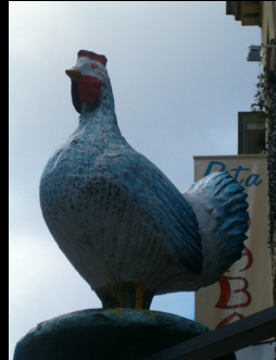
Papenstraat Oude Koornmarkt